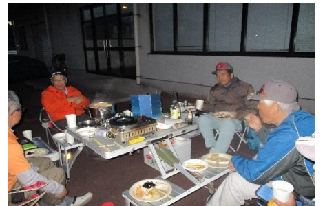
盛り上がっている風景