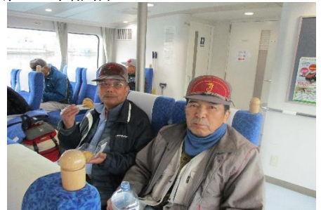
6時30分発のしおかぜ号に乗船したメンバー (気合が入っているような? 飲み過ぎの様なー)