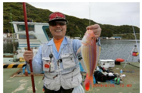
何時も写真写りの良い薬さん