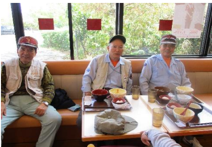
下村 渡辺 薬師寺