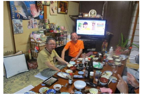
北詰氏・薬師寺氏