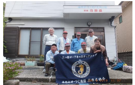
日振民宿の前で集合写真