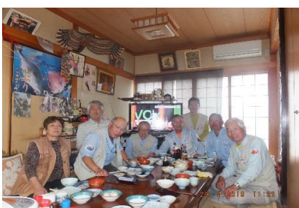
最後の日の朝食後の一枚