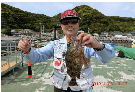
カサゴ爆釣の薬さん