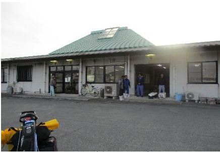
盛運汽船管理事務所