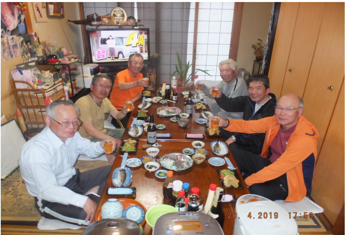
夕食(宴会)での乾杯