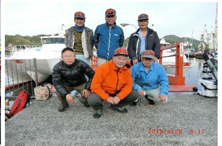
乗船前のメンバー