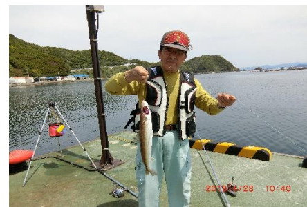
下村さんのワニエソ