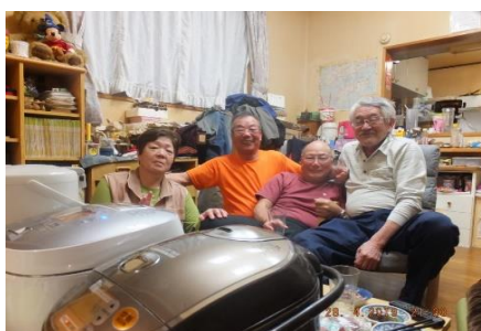
何時までも寝ないで小宴会