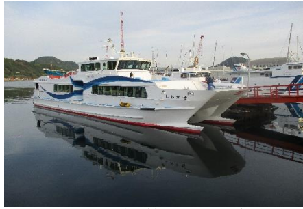
しおかぜ (能登・明海・喜路)