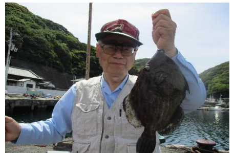
クラブ記録のカワハギゲット