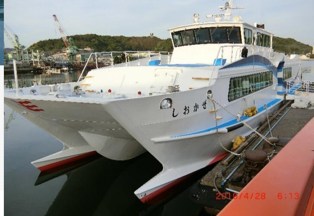
愛媛県宇和島市日振島喜路港 宇和島～日振島 直行高速船「しおかぜ」