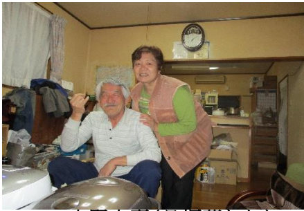
中野夫妻(日振荘ナナ)