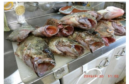
薬さんのカサゴ (薬師寺宅で)